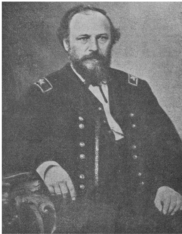
И. В. Турчанинов.

многочисленная артиллерия. Командующий Южной армией считал свою позицию неприступной. Он настолько был убежден в невозможности взять ее, что во время хода самого боя приказал снять с позиции 20.000 войска, к вечеру же снял еще одну дивизию.